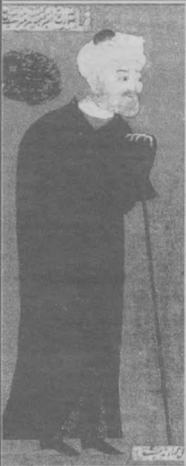
Турк назмида чу мен тортиб алам, Айладим уа мамлакатни яққалам.

Алишер Навоийнинг таълиму таълимига 558 йил тўғри