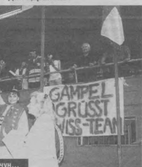
Ҳар бир ғалаба Ватанимиз шаъни учун...

-Ўзбек қизларининг каратэ билан шугулланишларига қандай қарайсиз?