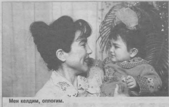
Мен келдим, оппогим.