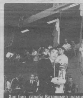
Ҳар бир ғалаба Ватанимиз шаъни учун...

- Нурхон ака, шоир, ёзувчи, хонанда, рассом бўлиш учун тугма истеъдод керак. Ҳар қанча машқ билан керакли дара-