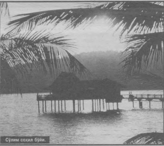
Сўлим соҳил бўйи.