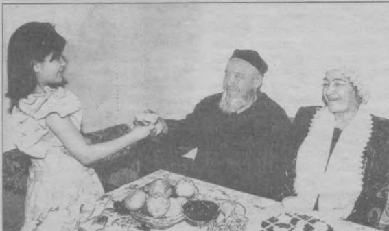
Невара қўлидан чой ичиш ҳар кимга ҳам насиб этсин.

Профессор: - Илмтиҳонда талабалар қайси сўзни кўпроқ ишлатишади? - Билмайман. - Бароқалла, тўғри топдингиз.