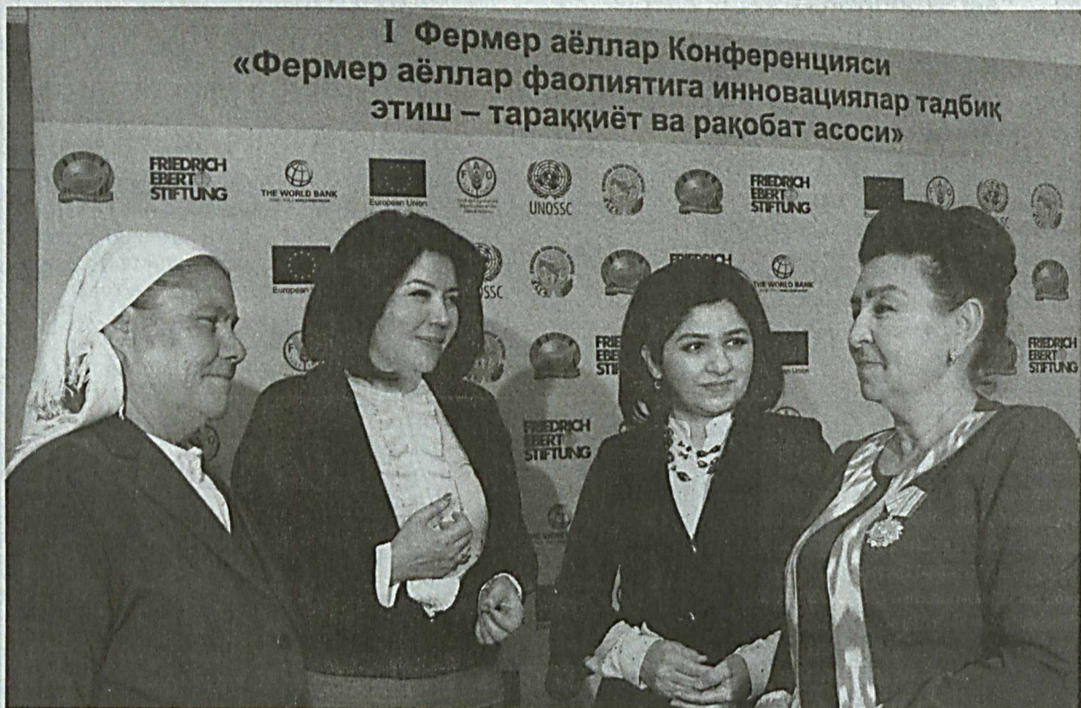
1 Фермер аёллар Конференцияси «Фермер аёллар фаолиятига инновациялар тадбиқ этиш – тараққиёт ва рақобат асоси»