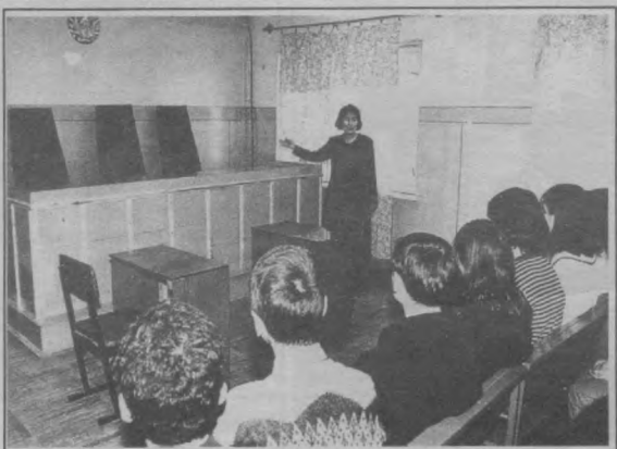
Бўлажак хуқуқшунослар суд залида.

Лекин, шунинг билан бирга уни жазодан озод этиш масаласи кўрилатганда содир этилган жиноятдаги тутган ўрни ва ролига алоҳида эътибор берилади.