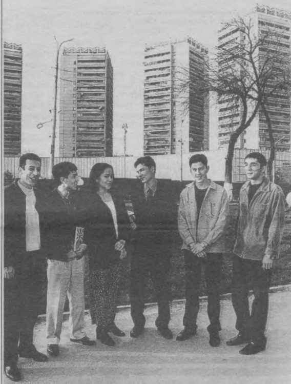
Бугунги кунда ўзбек ўғил-қизлари дунёнинг энг ривожланган давлатларидаги энг нуфузли олий ўқув даргоҳларида таҳсил олмақдалар. Сиз суратда кўриб турган ёшлар ҳам кунчиқар мамлақати - Япониянинг турли олий билим даргоҳларида таълим олиб қайтишган.