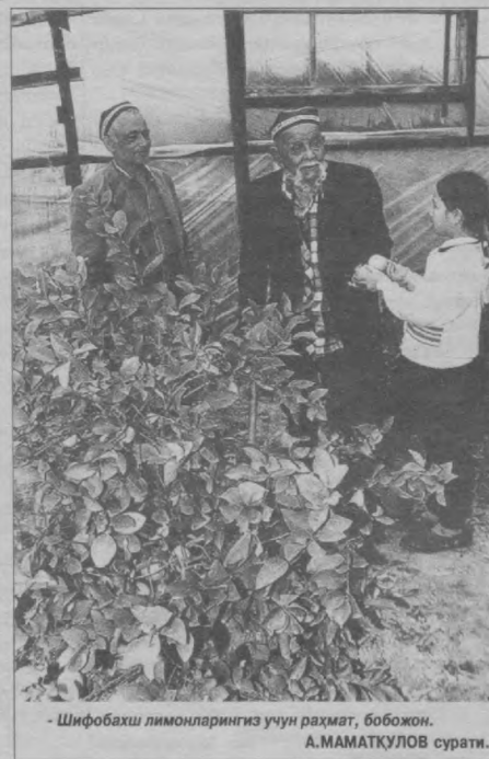
- Шифобахш лимонларингиз учун раҳмат, бобожон.