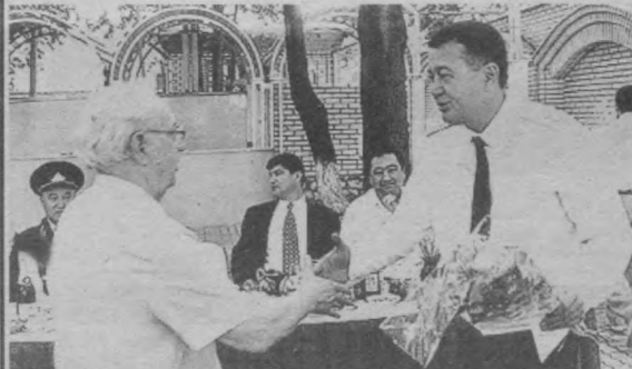
Ўзбекистон Республикаси Бош прокурори Усмон Худойқулов уруш ва меҳнат фахрийларини қутламоқда.

Байрам кўп йиллар прокуратура тизимида ишлаган устозлар билан ўлар шоғирд-