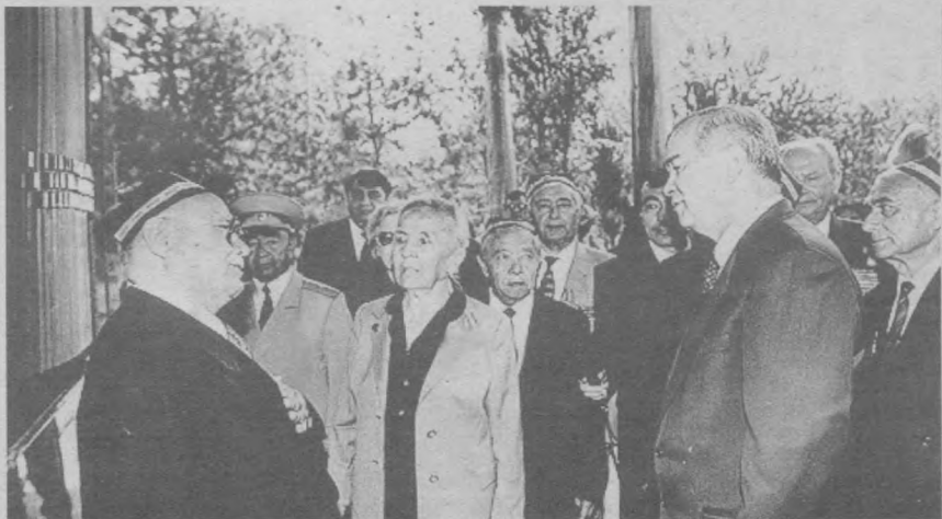
Президент Ислам Каримов пойтахтимизнинг Хотира майдонидаги байрам тантаналарида.