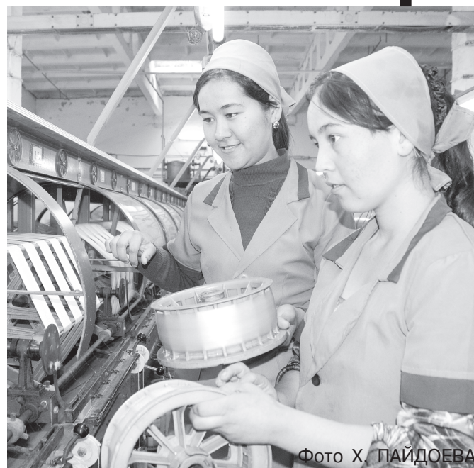
Фото X. ПЛАНОВА.