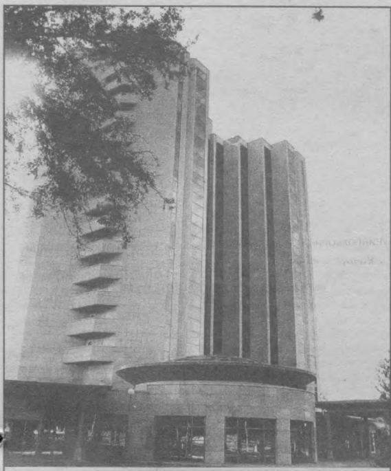
Ўзбекистон Республикаси мустақиллигининг 8 йиллиги олдидан

ЎЗБЕКИСТОН РЕСПУБЛИКАСИ ПРОКУРАТУРАСИНING ГАЗЕТАСИ