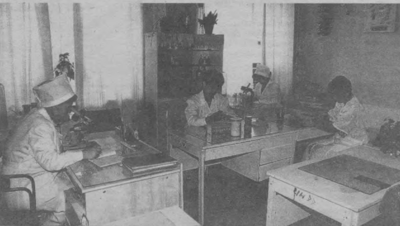
Суратда: Суд-тубийёт экспертизаси мутахассислари иш устида.