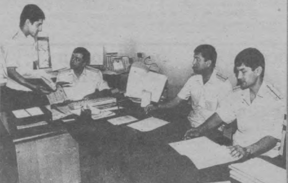
Суратда: Тошкент шаҳар прокуратурасининг прокуратура идораларида терговни назорат қилиш бўлими ходимлари.