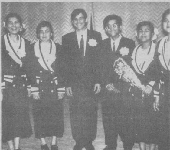
Республикамизнинг барча ўқув даргоҳларида бўлгани каби Наманган вилояти билим маскалларида ҳам «Сиз қонунни биласизми?» кўриктанловчи ўтказилишига жиддий эътибор қаратилди. Суратда: Танлов иштирокчиларидан бир гуруҳи.