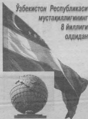
Ўзбекистон Республикаси мустақиллигининг 8 йиллиги олдидан

Нодир МАХМУДОВ, «Қонун ҳимоясида» журналининг масъул котиби.