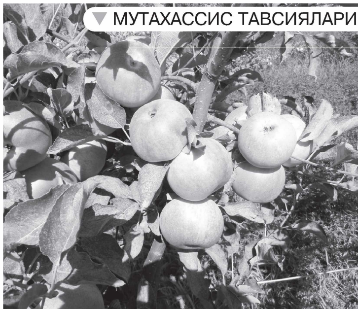
▼ МУТАХАССИС ТАВСИЯЛАРИ

Вертикал симбағазда ўстирилувчи ҳосилдор токни умумқабул қилинган технология бўйича кесиш зарур. Кесиш вақтида тупларда меъёридан 20-25 фоиз қўшимча кўзлар қолдирилади. Кучли ўсадиган Пушти тоифи, Нимранг, Ҳусайни, Қоракишмиш каби навларда кўзлар кўпроқ қолдирилиб, узунроқ кесилади. Бир тупда 200-300 тагача кўз қолдирилади. Ўртача ўсувчи Ркацителли, Саперави, Мускат навларида кўзлар сони