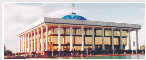
Олий Мажлис Қонунчилик палатасида

1974-йил 1-январдан чиқа бoshлаган Bahosi kelishilgan narxda.