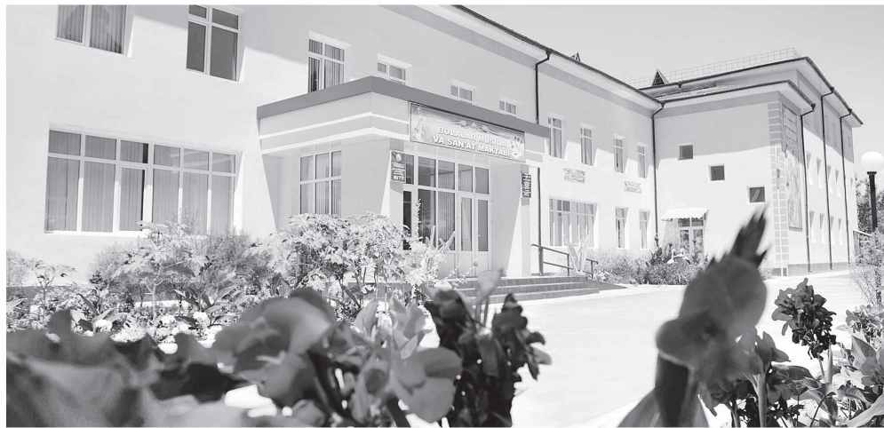
75-сонли Болалар мусиқа ва санъат мактаби.

магистралнинг Янгийўл тумани ҳудудидан ўтган қисмидаги олтига кўприк архитектура талабларига тўлиқ мос келадиган замонавий кўринишга эга бўлмоқда.