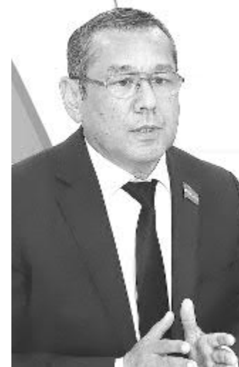
Улуғбек ИНОЯТОВ, Олий Мажлис Қонунчилик палатасидаги Ўзбекистон ХДП фракцияси раҳбари:

Тараққиёт стратегияси давлатимиз учун аҳамиятли бўлган барқарор ривожланиш мақсадлари ва 130 дан ортиқ индикаторларига тўла мос келади. Стратегия ва унга илова қилинаётган дастурнинг сўзсиз ва сифатли бажарилиши 2026 йилга келиб, БМТ томонидан эълон қилинган барқарор ривожланиш мақсадларини ҳам сўзсиз бажарилишига хизмат қилади.