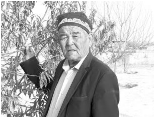
армон билан гапирган эди.

Дарров эсладим, "Чиял" бозорига борганимизда, кенг дашта аранг ўсиб турган 3-4 қайрағоч дарахтини кўргандим. Отам "Ана шу дарахтларни ўстирганга раҳмат, аммо кўплаб шомол йўлида тўсиқ бўлиб турган ихота дарахтларини кесиб кетишди", деб