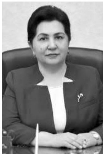
Танзила НОРБОЕВА, Олий Мажлис Сенати раиси:

– Эндиликда Сенат қўмиталарининг маҳаллий Кенгашлар доимий комиссиялари билан фаолияти мувофиқлаштирилади. Бундан ташқари, стратегияда давлат бошқарув органи фаолиятини фуқарога хизмат қилиш тамойили асосида шакллантириш кўзда тутилган.