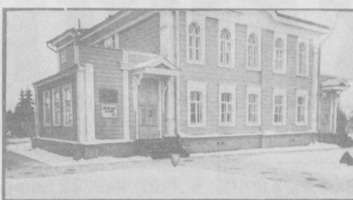
Ленинские Горки... У ҳар бир совет кишии учун, жаҳондаги барча мамлакатлар меҳнаткешлари учун қадрдон ва яқин эйератгоҳ ҳисобланади. Коммунистик партия ва совет давлатининг асосчиси В. И. Ленин шу ерда яшайди, ишлади ва дам олди, ўзининг энг касаллик кулларини шу ерда ўтказди, унинг юраги шу ерда уришдан тўхтади.