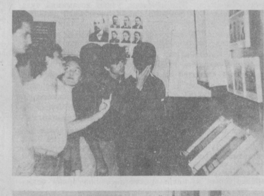
В. И. ЛЕНИН Марказий музейининг Тошкент филиали залларида. Р. Шожалилов фотолари.

— В. И. Ленин Марказий музейини шу кунгача 8,5 миллион киши келиб кўрди, — дейди музей директорининг ўринбосари Лобочевский. — Бу республика меҳнаткашларининг буюк инсонга бўлган чексиз меҳр-оқибатлари намунаси.