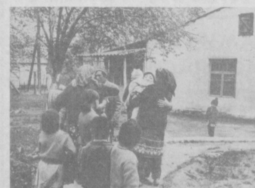
Суратларда: сув босган қишлоқлардан кўчирилган оиналарни қўшни хўжалик меҳнатқашлари ўз жигарғушаларидек қабул қилмоқдалар; бульдозерларнинг кирғоқ томон ҳужуми.

Издається на узбекском языке. Редакция адреси: 700083, ГСП, Тошкент Ленинград кўчаси, 32