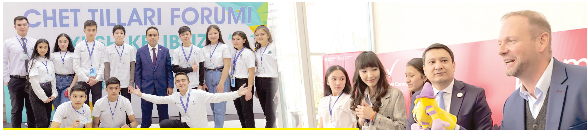
Молиявий имконияти чекланган ўқувчиларга