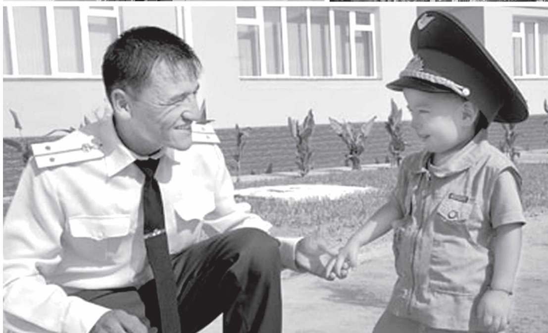
Ушбу муҳаббатимиз олган суратлар.

ши лозим бўлган ишларни аниқ ва пухта режалаштириш, зарур тавсия ва таклифларни ишлаб чиқишда муҳим омил бўлмоқда. Жойларда ўтказилган учрашув ҳамда давра суҳбатларида улар томонидан мамлакатимиз қонунчилигидаги мудофаа масалаларига оид ўзгартиш ва қўшимчалар, истиқболдаги вазифалар хусусида атрофлича маълумот бериб келинганлиги эса юртимиз посбонларининг ҳарбий қонунчилик борасидаги билимлари мустаҳкамлишига замин яратмоқда.