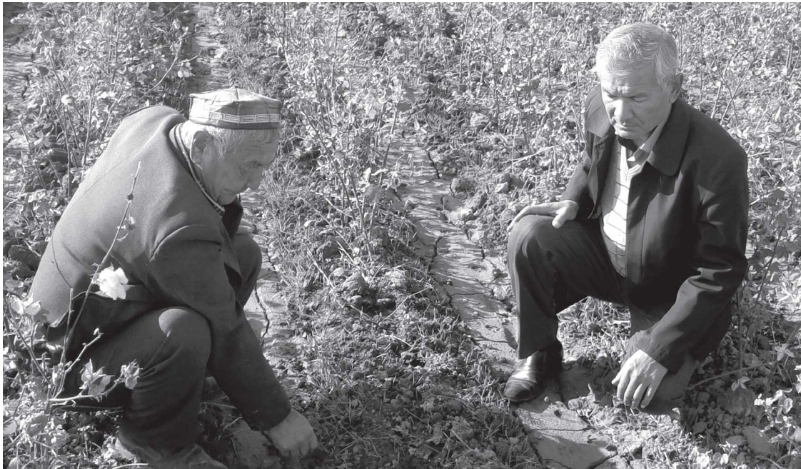
Кўзги башоқли дон экинлари парвариши ҳам маромида олиб борилмоқда. Бу эса майсаларнинг қишки тиним давригача туплаб олишига шароит яратмоқда.

Хўжалигимизда барча ишлар ўзимизнинг техникаларимиз, яъни занжирли, ишлов бериш, транспорт трактори, тиркамалар, плуг, чизел, борона ва бошқа механизмлар билан адо этилади. Тошкент вилояти ҳокимлиги томонидан юқори кўрсаткичларимиз