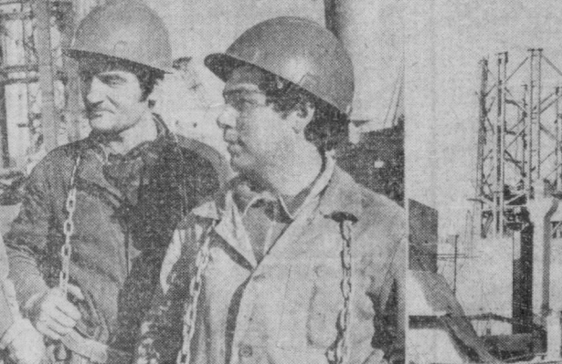
Энгельс қўчасида 350 метрли радио-телевизион минора қурилиши жадал суръатларда амалга оширилмоқда. Бинокорлар объектни қисқа вақтда қуриб битказиш учун илгори иш-усулларини ишлаб чиқаришда жорий эътибор...