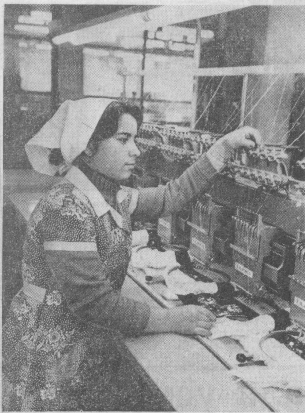
Тошкент бадиий буюмлар фабрикасида илгари кўп ишлар қўл кучи билан бажариларди. Ҳозир эса бу ерда ҳам машина-механизмлар, авто...