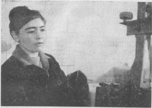
Тошкент ойна-мебель фабрикасининг ақил коллективи В. И. Ленин туғилган кунининг 110 йиллигини муносиб совғалар билан нишонлашга аҳд қилиб гайрат билан меҳнат қилмоқда.

ЎЗБЕКИСТОН КП ТОШКЕНТ ШАҲАР КОМИТЕТИ ВА ТОШКЕНТ ШАҲАР СОВЕТНИНГ ОРГАНИ