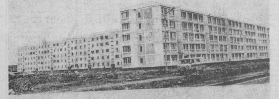
Шаҳримиз йил сайин обод ва кўрнам бўлмоқда. Бу ерда нўллаб турар жой бинолари, маданиятнинг объектлари қўйилди. СУРАТДА: Қорасув-3 массивида бунёд этилган янги турар жой бинолари.

Улуғ Ватан урушида ҳалок бўлган ҳарбий хизматчиларнинг оила аъзолари бўлган кишиларни аниқлаш пайтида баъзан муаммолар пайло бўлиб қолади. Юзга келган тажриба ва