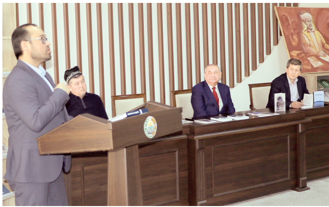
Бу фирқлар Пушкин номидаги вилоят ахборот-кутубхона марказида ўтказилган китоб тақдиротида таъкидланди. Тақдимот қилинган 3 томлик китоб буюк мутафак-

кир Алишер Навоийнинг "Ҳайрат ул-аброр" дostonининг мухтасар шарҳи, матн, насрий баён ва луғатни ўз ичига олган. Китоб навоий-шунос олим, ёзувчи Акром Малик томонидан тайёрланган.