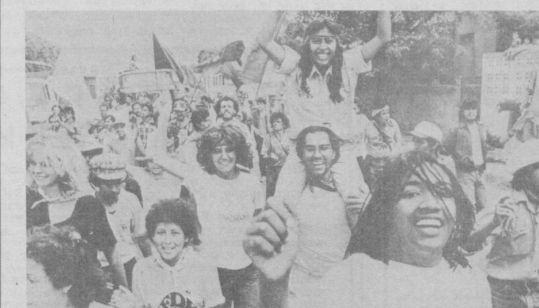
Ҳозирги вақтда Никарагуанинг кофе плантацияларида янги ҳосил учун қизил кураш бормоқда. Бу кампанияда маҳаллий аҳоли, Саидино халқ армияси жангчилари билан бирга бош-

Мамлакатнинг асосий экспорт маҳсулоти — шакарни ишлаш етиштирувчилар, баширчи, ҳокимият қанмоқда олинган қонуний ҳўкуматга қайтариб берилмас экан, ҳокимият ҳаммасини қўйди-қўйдибори билан дўқ қилди. Кнодо Цусин агентлигининг хабарларига кўра, қуроол қучларининг қўмондонлиги резервдаги қучларга доимий армия бўлиниларига қўйиб, норозилик намойишларини бостиришга тайёр бўлиб туришни буюрган.