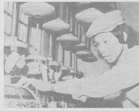
Социалистик Вьетнам рўзгор электр асбобларига бўлган эҳтиёжини иложини борица тўлароқ қондиришга ҳаракат қилмоқдалар. Тхай-бин вилоятидаги электр-механика заводи вентиляторларнинг янги моделини тайёрлашни улаштирди. Бу йил корхона бундай маҳсулот ишлаб чиқаришни анча қучайтирди. Суратда: тайёр маҳсулот текширини

Бу ерда Венгрия Совет Республикаси галабасининг биринчи кунда В. И. Ленинга юборилган радиogramмаинг, шунингдек Москвадан юборилган радиogramманинг ҳусулларини кўриш мумкин. В. И. Ленин, бутун рус пролетарнати бу радиogramмада ўз венгер қардошларининг тарихий галабасини табриқлагани эдилар.