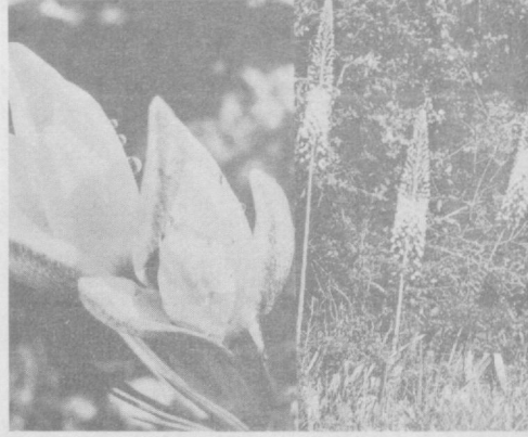
● ЗИРАВОР ҲСИМЛИКЛАРДАН—ЗАЪФАРОН