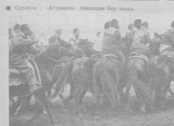
Суратда: «Кўпкари» ўйинидан бир лаҳза.

Мамлакатимизда ҳақлари таърихда эрлар давомида чавандозлик муким роль ўйнаган. Халқ эртакларида ҳам афсонавий уллолар ҳақида қуйланган. Бунинг кирғиз халқининг «Манас», қозоқ халқининг «Қанбар Ботир», қалмоқларнинг «Жанглар» ва якут халқининг «Ургун Боотур» эпосларида кўриш мумкин. Узоқ эрлардан буён то ҳозирги кунимизгача от спортининг чавандозлар, човган, кендан, сене, бағи каби орғинак турлари давом этиб келаяпти.