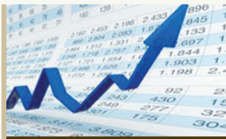
SANOAT O'SISHI BO'YICHA

Turkmanistonda navbatdan tashqari prezident saylovlari joriy yilning 12-mart kuni bo'lib o'tadi. Turkmaniston demokratik partiyasining navbatdan tashqari bo'lib o'tgan IX syezdida mamlakatning amaldagi Prezidenti Gurbanguli Berdimuhamedovning o'g'li Serdar Berdimuhamedov bo'lajak saylovlarda mamlakat prezidentligiga nomzod etib ko'rsatildi. Bu haqda "Salam News" nashri xabar berdi. Serdar Berdimuhamedov 1981-yilda tug'ilgan. 2018-yilda mamlakat tashqi ishlar vazirining o'rinbosari etib tayinlangan. 2020-yilda sanoat va qurilish vaziri lavozimini egallagan Serdar 2021-yil fevralidan buyon Bosh vazir o'rinbosari lavozimida ishlab kelmoqda.