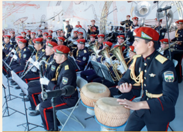
MILLIY GVARDIYA HARBIIY MUSIQA AKADEMIK LITSEIYI TASHKIL ETILDI

Shu kunga qadar yo'l bo'ylarida yangi qurilgan umumta'lim maktablari oldiga 22 ta quyosh panelli svetofor o'rnatildi. O'quvchi-yoshlarning xavfsiz harakatlanishlari uchun 125 ta ta'lim muassasasi oldida sun'iy notekisliklar yaratildi. Bu amaliyot ko'lami kengayib bormoqda. Joriy yilning o'zida yana 462 ta ta'lim muassasasi oldiga notekisliklar o'rnatish rejalashtirilgan. Piyodalar o'tish joylariga 132 ta yoritish moslamasi o'rnatildi.