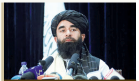
AYBLOVLARNI RAD ETDI

Qozog'istonda hashamat uchun soliq joriy etish imkoniyati ko'rib chiqilmoqda. Ma'lumotlarga ko'ra, mamlakat Milliy iqtisodiyot vazirligi mazkur masala ustida ish olib bormoqda. Xususan, lyuks toifasidagi avtomashinalarga ("Aston Martin", "Bentley", "Ferrari", "Lamborghini", "Maserati" va h.k.) oshirilgan miqdordagi soliq joriy etish taklif qilinmoqda. Shuningdek, ayrim toifadagi uchuvchi qurilmalar, yaxtalar va respublika ahamiyatidagi shaharlar, viloyat markazlari, kurort hududlarda joylashgan ko'chmas mulklar ham hashamat deb e'tirof etiladi. Bunday mulklarga nisbatan mulk solig'ining oshirilgan koeffitsiyenti joriy etiladi.