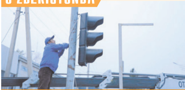
FARG'ONADA QUYOSH BATAREYALARI YORDAMIDA ISHLAYDIGAN KO'CHMA SVETOFORLAR O'RNATILMOQDA

Zamonaviy yo'l belgilari va svetoforlarning o'rnatilishi bunda muhim ahamiyat kasb etmoqda.