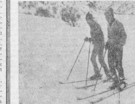
Суратда: Тоғ бағрида. М. Нуриддинов фотоси.

Ҳар шанба ва яқшаба кунлари ҳамшаҳарларимиз Чимён тоғ бағрига йўл олаётлар. Шаҳаримиздаги Шастри автостанциясидан бу маршрут бўйлаб автобуслар қатнаб турибди. Эртага эрталаб эса Собир Раҳимов районидан 45 та автобус қорларга бурканган гўзал Чимён томон йўл олади. Райондаги «Компрессор», «Миконда», «Автомобиль» ремонт заводалари, бош кийимлар фабрикаси, Тошкент давлат университетининг «ТашХИИЭП» лойиҳа институти ҳамда бошқа ташкилотларнинг ишчи ва хизматчилари тоғ сайига чиқадилар. Улар бу ерда қанчалик, қанчалик уқидилар. Чангиллар ўртасида мусобақа ўтказилади. Дам олувчиларга бадиий ҳаваскорлар, ошхона ва савдо ходимлари хизмат қўрсатишади.