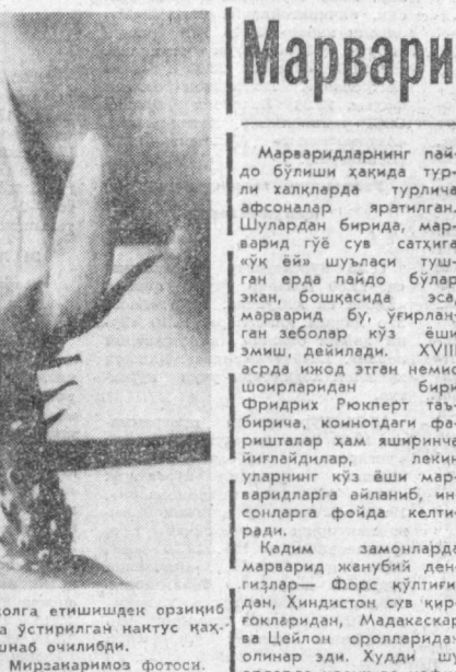
Кантус гуллашини висолга етишишдек оразини кутилди. Қарангки, уйда ўстирилган кантус қа- ратон киш чиласида лшма очилди.

Қундалик ҳаётимиз Сону мента берар дурс. Бу дарсга ҳар ўн-қиз Анал қилмоғи бир фарз Бу ҳам бир дарс. Баҳонг беш, Уқишу иш бўлсин эш. Кўча-қўйда йўлнинг эш. Чикса каттами-кичкми — Салом бериб кўнгилдан, Саломга ол анки. Бу ҳам бир дарс. Баҳонг беш, Уқишу иш бўлсин эш. Кўча-қўйда йўлнинг эш. Мункиллаб юрса зурга, Қараб турма. Чоп дарҳол, Солб қўй уни йўлга. Бу ҳам бир дарс. Баҳонг беш, Уқишу иш бўлсин эш. Кўчма қандай иш, Дом баҳонг беш бўлсин Беш бўлсин юриш-туриш. Уқишу иш эш бўлсин. Бу ҳам бир дарс. Баҳонг беш, Уқишу иш бўлсин эш. Кўчма қандай иш, Дом баҳонг беш бўлсин Беш бўлсин юриш-туриш. Уқишу иш эш бўлсин. Бу ҳам бир дарс.