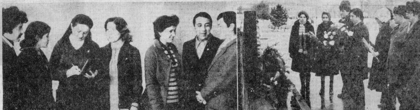
СУРАТЛАРДА: XXVII шаҳар комсомол ҳисобот-сайлов конференцияси делегатларидан бир гуруҳаси; конференция делегатлари В. И. Ленин ҳайали пойга гулчамбарлар кўйинида.

лат назар ва уларнинг остига тўшаладиган беш ишларга қурилиш майдонини бўйлаб ташиб беришмоқда. Бунёдкорлик ишларини амалга оширишнинг кўп миқдорда капитал маблағ ажратилган. План бўйича беш шу йилнинг ўзида 380 миң сўмлик қурилиш ишларини бажаришга керак. Иккинчи имкониятларни ҳисоблаб чиқиб, бу рақамни бундан ҳам оширишмоқчилик. Обьектин икки йил ичиде асос, яъни келгуси йилнинг май ойида фойдаланишга топириш ниятидамиз.