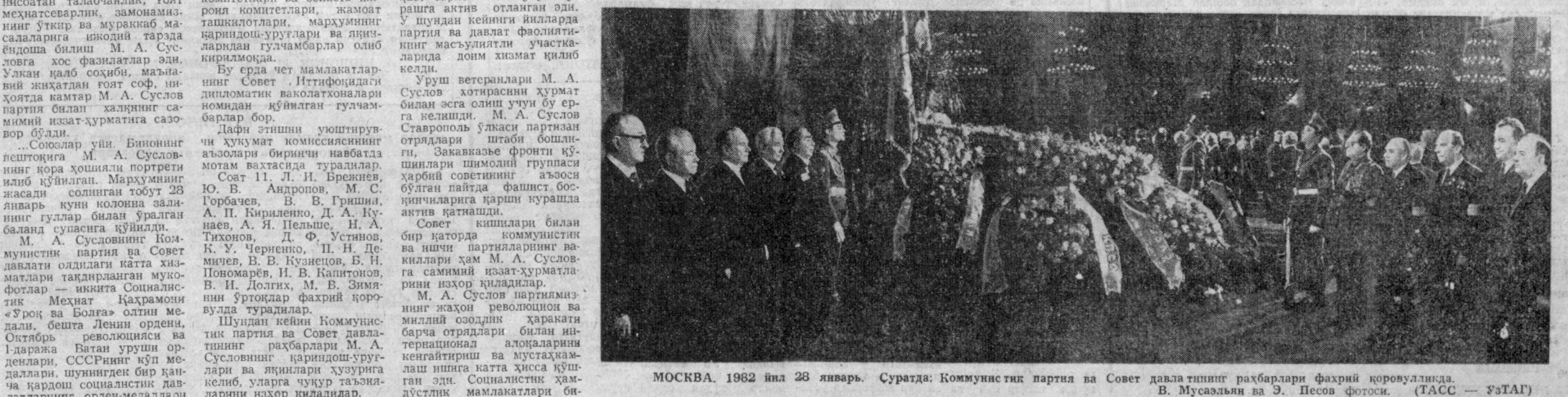
МОСКВА, 1982 йил 28 январь. Суратда: Коммунистик партия ва Совет давлатининг раҳбарлари фахрий қорувулди.

Д. Махаллий газета-ларда «Қурувчиларнинг улкан режалари» сарлавҳаси остида Ўзбекистон ССР қурилиш, монтаж, лойиҳа ташкилотлари ва қурилиш материаллари ҳамда қурилиш индустрияси саноати корхоналари коллективларининг 1982 йилги социалистик мажбуриятлари эълон қилинган.