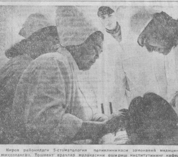
Иров районидан 5-стоматология поликлиникаси замонавий медицина приборлари билан жиҳозланган. Тошкент врачлар малазасини ошириш институтининг кафедраси ҳам шу ерда иш-лаб турибди.

Овқатларни қайноқ ҳолда истеъмол қилиш нақадим ўнатиш керак. Овқатларни қайноқ ҳолда истеъмол қилиш нақадим ўнатиш керак. Овқатларни қайноқ ҳолда истеъмол қилиш нақадим ўнатиш керак.