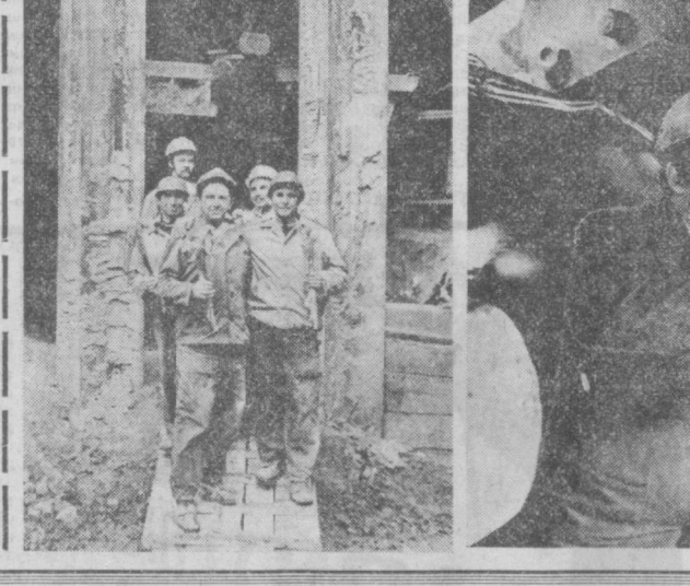
Лаҳим қазувчи машинанинг овози бирдан тўхтади.

Бу саноат, транспорт ва алоқа корхоналари коллективлари КПСС Марказий Комитетининг ноябрь 1978 йил Пленуми қарорларига амалда иш билан жавоб беришиб, беш йилликнинг тўртинчи йили зарбдор вахтасини бошлаб юбордилар.