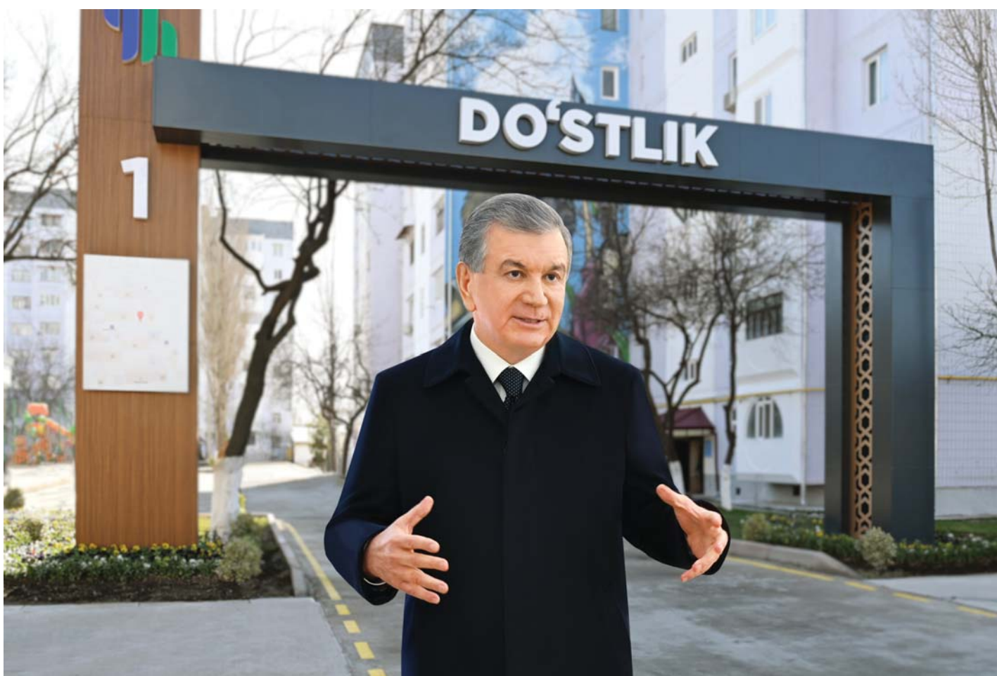
Президент Шавкат Мирзиёев барои шинос гардидан бо ҳаёти маҳалла ва объектҳои санаяти аз ноҳияи Янги ҳаёти шаҳри Тошканд боздид ба амал овард.

Дар ноҳияи Янги ҳаёт имрӯз ҳаёт воқеан ҷўш мезанад. Дар ин ҳудуд, ки собиқ марбути ноҳияи Сергелӣ буд, дар муддати кўтоҳ сарҳад иморатҳои бисёррошана бунёд гардида, ҳазорҳо оила соҳиби манзил гардиданд. Хати метро, роҳҳо, пулҳо сохта шуда, инфрасохтори муносиб ба вучуд оварда шудааст. Роҳбари давлат дар ташири пешини худ ба Янги ҳаёт бо назардошти афзоиши аҳоли дар боари ноғозирни сохтмони корхонаҳои нав, объектҳои истеҳсоли, ба вучуд овардани ҷойҳои кор сухан ба миён оварда буд. Имрӯз ташаббусҳои роҳбарии давлат ба навбат ба ҳаёт татбиқ мегардад. Ҳоли ҳозир дар ноҳия теъдоди корхонаҳои калони санаяти то 10-то расидааст. Беш аз 2 ҳазор субъекти тиҷорати хурд ғайолият дорад.