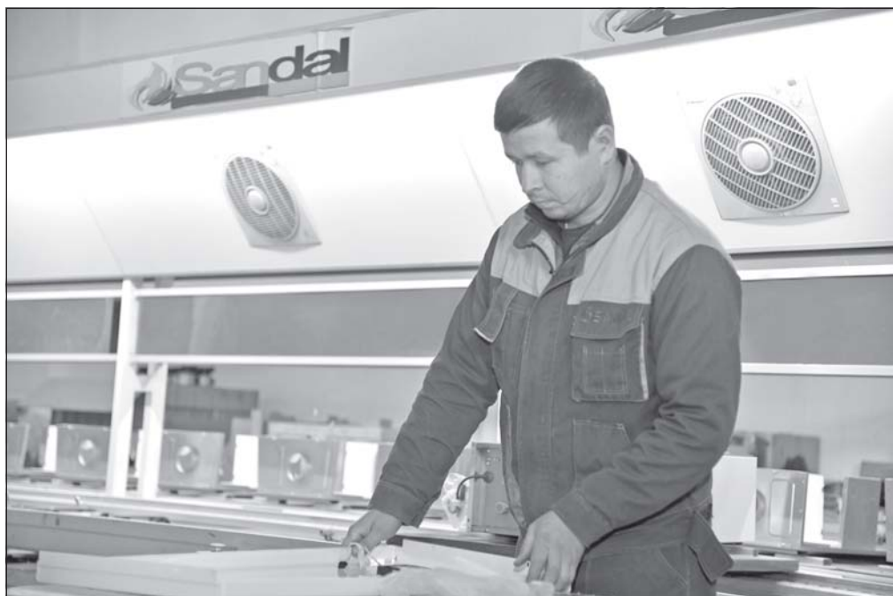
Дар ҷамъияти масъулиятш маҳдуди «Thermo install»-и шаҳри Навой, ки соли 2019 созон дода шудааст, дар асоси технологияҳои замонавӣ деғҳои гармидиҳӣ ва барои гарм кардани биноҳои ҷамъиятӣ хусусӣ радиаторҳо истеҳсол менамоянд. 120 нафар қорғари қорхона, ки қисми зиёдашонро қорамандони ташкил медиҳанд, ба ҳисоби миёна соли 22 ҳазор дона ин гуна маҳсулот истеҳсол менамоянд. Зиёд кардани навҳои маҳсулот дар нақша аст.

Дар акс: дар ҷамъияти масъулиятш маҳдуди маъмур.