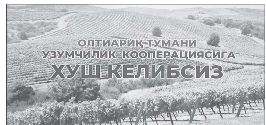
ОЛТИАРИҚ-ТУМАНИ УЗУМЧИЛИК-КООПЕРАЦИЯСИГА ХУШ-КЕЛИБСИЗ

Маълум шуд, ки заминҳои азхудшуда ба микдори 20-25 сотиҳи худдан ба 4 ҳазор хонаводаи шаҳраки Катпут тақсим карда мешавад. Бонқи саҳҷой-тиҷоратии «Агробанк» барои онҳо ба мuddати то 7 сол ва аз ин мuddат 3 солш қорзи имлӣёноқи 14 фоизӣ илтисои медиҳад. Ин маблағ дар маҷмӯъ 30 миллион сӯмро ташкил хоҳад дод. Гуфта мешавад, ки