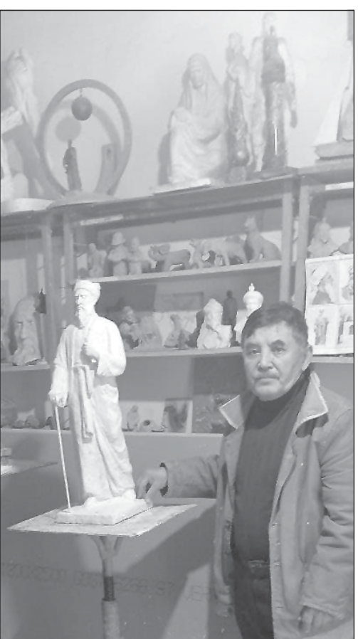
дан лозим! — мегӯяд Исоев.

— Мардуми ҷимматбанд метавонанд ин маблағро ҷамъ кунанд. Танҳо ба ин мардум муроҷиат кар-