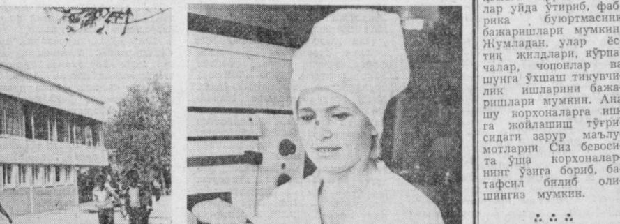
«АЛЕНУШКА» ТАКЛИФ ЭТАДИ

«Чевар» тикувчилик ишлаб чиқариш биноси, бадирий буюмлар фабрикаси, «Сувенир» тўймачилик ва галантери фабрикалари тузади. Ана шу корхоналарнинг биротаси билан тузилган шартномага кўра, чеварлар уйда ўтириб, фабрика буюртмасини бажаришлари мумкин. Жумладан, улар естий қилдилар, қўриқчалар, чопонлар ва шунга ўхшаш тикувчилик ишларини бажаришлари мумкин. Ана шу корхоналарга ишга жойлаштириш тўғрисидаги зарур маълумотларни Сиз бевосита ўша корхоналарнинг ўзига бориб, батафсил билиб олишингиз мумкин.