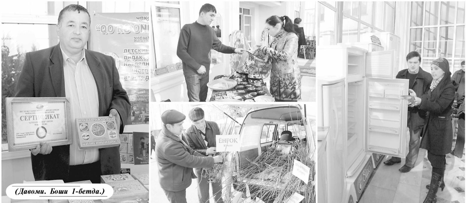
(Давоми. Боши 1-бетда.)

партиямиз Сайловолди дастурида белгиланган вазифаларни амалга оширишга хизмат қилмоқда