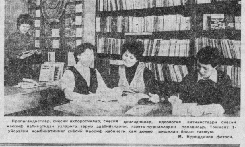
Пропандистлар, сийсий аҳборотчилар, сийсий донадчилар, идеология антицистлари сийсий маориф кабинетидан ўзларига зарур адабиётларни, газета-журналларни топадилар. Тошкент 1-уйсозлик комбинатининг сийсий маориф кабинети ҳам доимо идишлар билан гаузум.

1960 йилдан бошлаб бу ерда Ўрта Осиё олий ўқув юрталари чет тили кафедралари ўқитувчилари билан семинар йиғини систематик ўтказиб келинмоқда. Институт ўқитувчиларининг ташаббуси билан 1967 йилдан бошлаб телевидение орқали сирти бўлим студиялари учун чет тили бўйича ўқув телевидео эшиттиришлари систематик олиб боришмоқда. Институтда кино зал, лингвостудия ва киноаппаратлари билан жиҳозланган кинозал мавжуд. Фонотекаларда инглиз, немис, француз, испан, рус ва ўзбек тиллари бўйича сонинг уч мингдан ортиқ фонограммалар мавжуд. Шунингдек фильмотекада беш юздан зиёд диафильмлар, кинофильмлар мавжуд. Яқинда ўқитишнинг техника воситалари лабораторияси яна янги лингвостудия аппаратураси билан боғлиқлик билан ўқув жараёнида техника воситалари ва программалаштириш ва таълим элементларини қўллаш бўйича турли-туман Советнинг бу борадаги ишлари айниқса самарали бўлади. Яқинда ўтказилган иккинчи ҳафталик лекция ва семинар кенгаш йиғилиши ҳам шу мавзуга бағишланди.