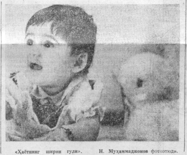
«Ҳаётнинг ширин гули».

ШЛИНИНГ олтин дунёларини дейишди. Аслида инсон умрининг ҳаммаси олтин, таърифи етганда унинг баҳоси йўқ. Бир марта берилган умрини қадраш, тегаш керак. 27 йил урғун бўлиб рус шoirи Лермонтов, 38 йил яшаган А. С. Пушкин ва 85 баҳорининг қаршилай олган баҳор кўчиси Х. Олимжон вақтдан баҳраманд бўлиб, умрларининг минг эиба мерос қолдирилган.