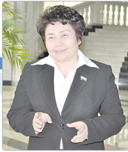
Дилбар ХОЛИКОВА, Олий Мажлис Қонунчилик палатаси депутаты, ЎзХДП фракцияси аъзоси.