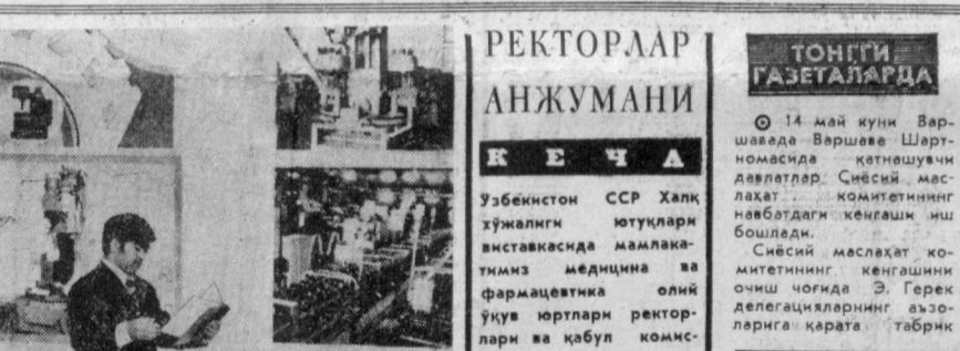
У. ЮСУПОВНИНГ 80 ЙИЛЛИГИ ШАРАФИГА

1937—1950 йилларда Ўзбекистон партия ташкилотига бошлиқлик қилган таълиқ партия ва давлат арбоби Умаров Юсуфов туғилган кунининг 80 йиллиги бағишлаб 14 май кунини Тошкентда шаҳар жамоатчилигининг тантанали йиллиги бўлиб ўтди. Йиллигини Тошкент шаҳар партия комитетининг биринчи секретари У. Умаров очди. Ўзбекистон Компартияси Марказий Комитети ҳузуридаги Партия тарихи институтининг директори, Ўзбекистон ССР Фанлар академиясининг мухбир аъзоси Х. Т. Турсунов У. Юсуповнинг ҳаёти ва фаолияти тўғрисида доклад қилди. Докладчи ва йиллигида сўзга чиққан кишилар У. Юсуповнинг ленинча миллий сўбатни амалга оширишдаги хизматлари тўғрисида, унинг совет пахтачилигини ривожлантиришга, республика экономикаси ва маданиятини раванқ топтиришга қўшган ҳиссаси ҳақида гапирдилар. У. Юсуповнинг ташкилотчилик қобилияти Умаров туғилган йилларида, айниқса, ёртин намоян бўлди. Уша пайтда