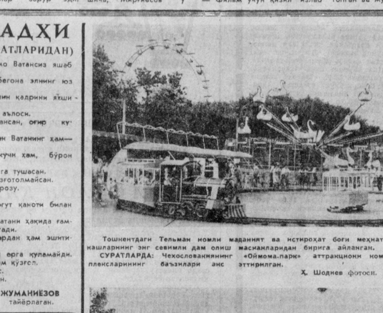
Тошкентдаги Тельман номи маданият ва истироҳат боғи меҳнатчиларнинг энг севимли дам олиш масжидларидан бирига айланган. СУРАТЛАРДА: Хелосовларнинг «Ойнома-парки» аттракционини ном. плексларининг баъзилари акс эттирилган. X. Шодиев фотоси.

— Орадан яна уч йил ўтса, бу ноёр минордан хен нараса қолмайди. Кисқис, Туркистонлик археологлар бу ердаги қадимги ёдгорликларини ўз хомаларига олишмасдан ва тарих бизни кечирмайди.