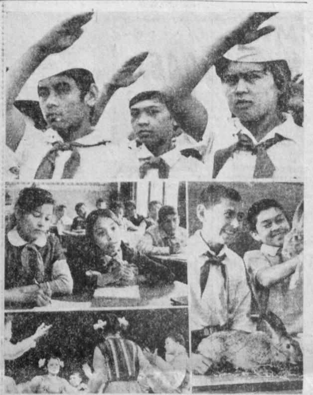
Пионерларнинг ушбу салютида Коммунистик партия, Ленин комсомолнинг ҳаммурағи ағалар иш билан жавоб беришга шай эдилар. Мамлакатда пионерларга ўз истеъдодлари ва қобилиятларини намойиш этишлари учун барча имкониятлар яратилган.