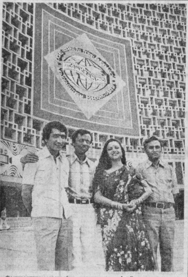
Фестивалнинг дастлабки меҳмонлари.