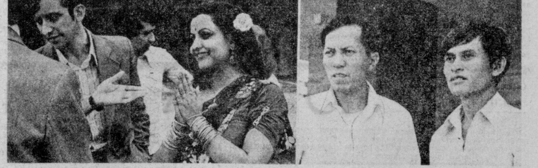
Бугун Тошкентда бошланган Осиё, Африка ва Лотин Америкаси мамлакатларининг халқаро кинофестивали қатнашчилари шахримизнинг диққатга сазовор юнлари билан танишмоқдалар, томошбинлар билан суҳбатлашмоқдалар.

шаҳри ва у ерда бўлаётган халқаро анжуман ҳақида чиройли раҳбарларнинг надрларга тушириш истагини бор. Бундан ташқари, ўзбек ёзувчилари ва кинорежиссёрлари билан учрашиш, давра қуриш, фикр алмашиш, ҳулаас дўстлик муносабатларимизни янада кенгайтириш ниҳтидаимиз. Мен ўйлайманки, Совет Иттифоқи ва Туркия мамлакатлари ўртасидagi маданий алоқаларимиз бундай буюб ҳам баланд парвоз қилади.