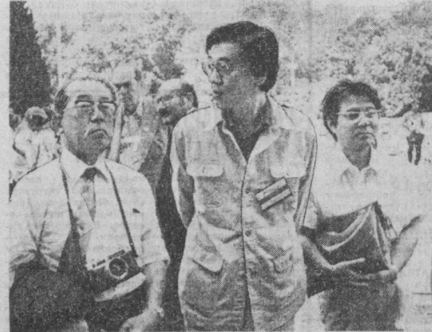
Мана бир неча кундирин, Тошкентда «Тинчлик, социал тараққиёт ва халқлар озодлиги учун» ширин остида Оснб, Африка ва Лотин Америкаси мамлакатларининг кинофестивали муваффақиятли ўтмоқда. СУРАТДА: кинофестиваль қатнашчиларидан бир группаси шахримиз билан қийиндан танишмоқдалар.

тиш мумкин. Киносанъаткорларнинг энг яхши истақларимиздан бири ўзбек маданияти арбоблари билан янги дўстлик мусоабаларини ўрнатиб ва уни ривожлантириш д и р. Ана шу мақсадда учрашувлар ўтказиш интиямиз бор.