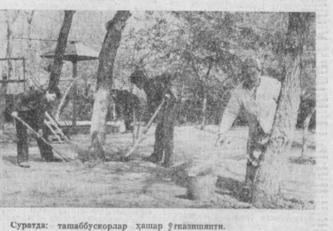
Суратда: ташаббускорлар ҳашар ўтқазиништи.

Тартиб топган анъанави кўра уларга иорхона ва ташкилотларнинг меҳнатчилари, микрорайон ва маҳалладаги аҳолининг ёрдами келмоқда. Улар ҳам пойтахтининг 2000 йилги юбилейига таъдирли қаршилик ақтив қатнашмоқдалар.