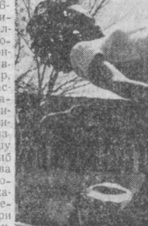
СУРАТЛАРДА: баландлик забт этилди; 60 метрга югурувчилар учун старт берилди.

Шашка бўйича ўтказилган мусобақада Октябрь районидан 186-мактаб ўқувчилари биринчи ўринни эгаллашди. Шахмат мусобақасида шу районнинг 19-мактаб ўқувчилари галиб чиқдилар. Болалар ўртасида баскетбол бўйича ўтказилган мусобақада қилонзорлик ёшлар бўлишиди. Қизлар баҳсида ҳам шу район вакиллари галиб чиқди. Болалар ва қизлар ўртасида волейбол бўйича ўтказилган баҳсларда Ленин райони вакиллари нешқадамлик қилдилар.