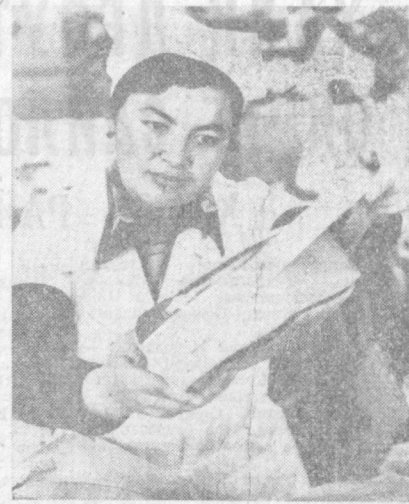
В. И. Ленин туғилган куннинг 112 йиллигига бағишлаб ўтказилган коммунистик шанбалик кун Тошкент химия-фармацевтика заводининг коллективи ҳам пухта тайёргарлик кўриб кўйди. Шу кун завод иши ва хизматчилари энг юқори меҳнат унумдорлигига эришишга аҳд қилдилар.

(КПСС Марказий Комитетининг 1 Май Чақириқларидан).