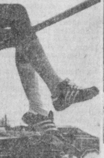
СУРАТЛАРДА: баландлик забт этилди; 60 метрга югурувчилар учун старт берилди.