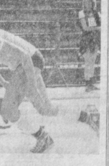
СУРАТЛАРДА: баландлик забт этилди; 60 метрга югурувчилар учун старт берилди.