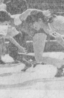
СУРАТЛАРДА: баландлик забт этилди; 60 метрга югурувчилар учун старт берилди.