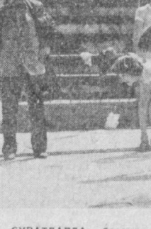
СУРАТЛАРДА: баландлик забт этилди; 60 метрга югурувчилар учун старт берилди.