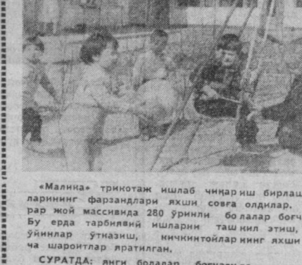
«Малина» триотаж ишлаб чиқариш бирлашмаси ишчи ва хизматчиларининг фарзандлари яхши соғала олдилар. Улар учун Юнусовоб турар жой массивида 280 ўринли болалар богчаси ўз эшикларини очди. Бу ерда тарбиялий ишларни ташкил этиш, болалар билан турли ўйинлар ўтказиш, кичикнотойларнинг яхши дам олишлари учун барча шароитлар яратилган.

тавон уйда оз эмас, кўп эмас 190 хўжалик яшайди. 75-уй ахли баҳорда дарахт ўтказишди. Ҳазарча қўламазор қилмоқчи бўлишди. Яқинда наставка юк машинаси майдонча олдига келиб тўхтади. Машинадан хай-хай сурон билан темир гараж тушириб бошладилар.