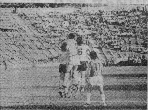
СУРАТЛАРДА: «Пахтакор» — «Шахтер» учрашувидан лавҳалар тасвир-ламган.