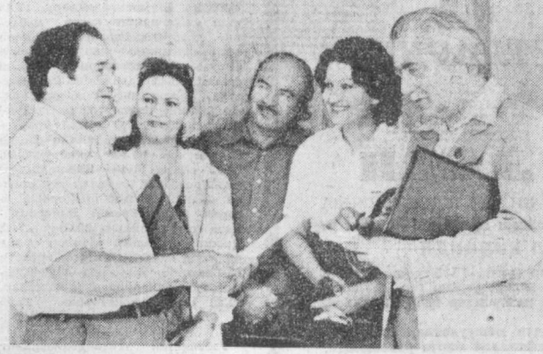
СУРАТДА: республикада ўтаётган Озарбайжон адабиёти ва санъати кунлари қатнашчиларидан бир гуруҳи — Озарбайжон ССРда хизмат кўрсатган санъат арбоби К. Керимов, Озарбайжон ССР халқ артистлари А. Панахова, Г. Байрамов, Р. Керимова ва режиссер Ж. Мамедов.

Нозим РИЗАЕВ, Озарбайжон камер оркестрининг бадий раҳбари ва бош дирижери, Озарбайжон ССР халқ артисти. Бизнинг гастроль сафарларимиз Самарқанд, Бухоро, Навоий шаҳарлари бўйлаб ўтади. Бу қадимий шаҳарларни кўриш, унинг тарихий обидаларини томоша қилиш, бунёдкорлик қилган олдни кишиларни кўриш бизга гўяда қувонч келтиради. Биринчидан, биз санъатимизни манавар, эталон, инқилибдан, шайнинг ўлканинг ҳақиқат олам-олам таассурот оламини, ўзбекистон ва Озарбайжон халқлари арасидаги бундай дўстлик ва маданий алоқаларимиз яна янги сайин парвоз қилаётганига, ишончим комил.