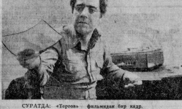
СУРАТДА: «Тергов» фильмдан бир кадр.