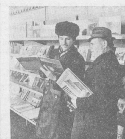
Ўзбекистон халқ ҳужжалиги ютуқлари кўргазмасида «Ташкилотнинг» китоб-альбомлар билан...