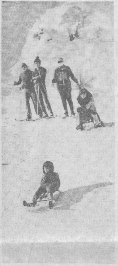
ЧАНАДА ТУШИШ ГАШТИ.