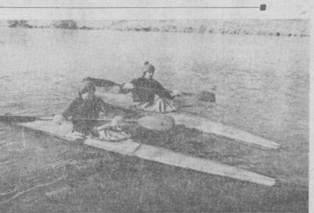
Тошкентлик эшкан эшувчилар қишда ҳам ўз машғулларини тўхтатмадилар.

Чимён ён бағирлари чиндан ҳам ҳамшаҳарларимизнинг энг сеvimли дам олиш масканларидан бири ҳисобланади. Кўёш нуринда товланаётган олоқ қор, тоза тоғ ҳавоси, чангида учиб гаши, тоғ манзаралари кимни жалб этмайди? Эндилдида тошкентликлар олдига Чимёнга қандай етиб бориш мумкин масала эмиас. Дам олиш кўнларини инан район меҳнаткашларини и г т тоғ бағрига оммавий чинини яхши йўлга қўйилган. Ана шу