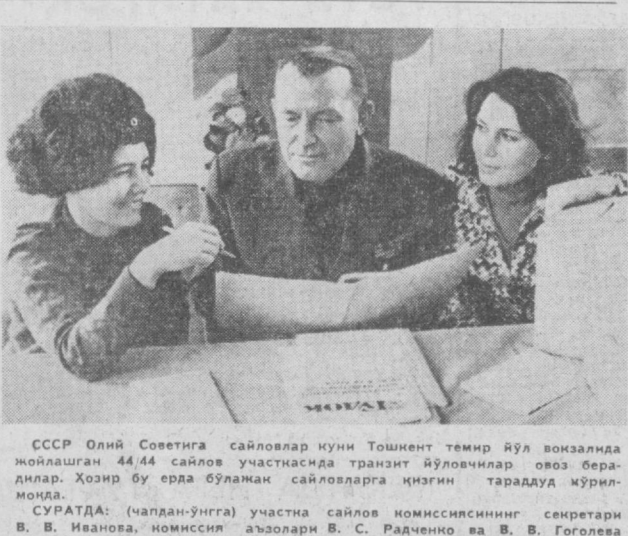
СССР Олий Советига сайловлар кунини Тошкент темир йўл вокзалида жойлашган 44,44 сайлов участкасида транспорт йўловчилар овоз беришди. Ҳозир бу ерда бўлмаган сайловларга қизғин тараққуд ўрилмоқда.

Ўтган беш йиллик охирида Питомная кўчасида шаҳар ҳалқ йўли ёнигисидан 3-автокомбинатнинг ишлаб чиқариш комплекс қад кўтарди. Бу ерда кенг ва муқтадам асосий корпус бўвуд этилди. 72х142 метрдан иборат бўлган бу бинода барча ишлаб чиқариш-ремонт участкалари ва хизматлари, ошкона, дам олиш хонаси, соғиналарнинг меҳнатчиларининг 13,8 процентга ўсди. Озиқ-овқат маҳсулотларини умумий оқатланиш корхоналарига ва савдо тармоқларига ташиндиган ҳайдовчилар заур уюкларни жойларга етказиш муқддирини анча қисқартирдилар. Ўтган йили 3-автокомбинатда бўлган Ўзаро Иқтисодий Ердам Кенгаши аъзолари бўлган мамлакатлар — Болгария, Венгрия, Куба, Руминия, ГДР мутахассис-автомобиллар Тошкент автомобилчиларининг меҳнатни юксак даражада ташкил этганликларини, участкалар техник жиҳатдан яхши жиҳозланганлигини, ҳўжаликни бошқариш юқори даражада оналигини таъкидладилар.