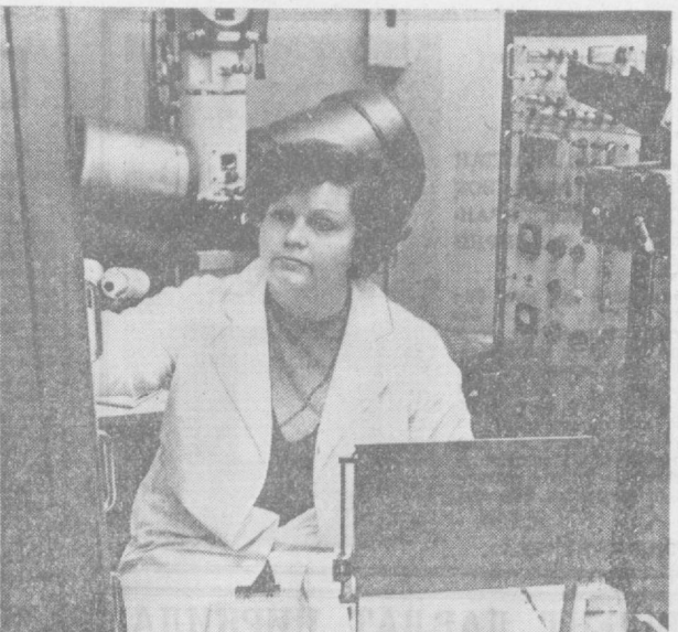
Геолог олимларимиз тоғ-тошларни, қир-чўллارни кезиб, машаққатли меҳнат билан кон дарачиларини излайдилар. Топилма тошларни лабораторияларда текшириб кўрадилар. Бундай ишлар Ҳ. Абдуллаев номидаги геология ва геофизика институтининг лабораторияларида бажарилади.

Шунинг ҳам айтиш кераки, республика партия ва ҳукумати Тошкент шаҳрини ривожлантириш бош планининг асосий принциплари тўғрисидаги кўрсатмасига биноан, Тошкент шаҳрида яқин тартинда уй-жой қурилиши учун ер участкаси бўлиб бериш таъинланган. Бунда илгари яна тартинда уй-жой қурилиши учун ажратилган массивлар бундан мустақилдир.