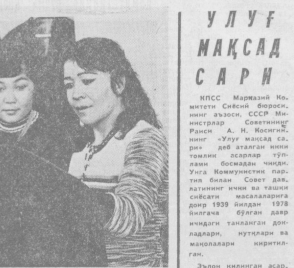
Ленин номи йил тартибда буюртмалар тикувчи бirlашма колленти...