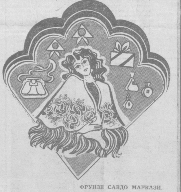
ФРУНЗЕ САВДО МАРКАЗИ.

Трикотаж бўлимида жун ва ярим жун жакетлар, кофталар, жемперлар, ички кийимлар харид қилиш мумкин. 8 март байрамини хотин-қизлар учун газлама яхши совга бўлади. Ундан кўйлақ, блузка, сарафан, халат тикиш мумкин. Магазинда хилма-хил крешенини, крешжоржет, штапель газламалар харидорларни кутмоқда. Трикотаж ва шойи газламадан республика моделлар уйи мутахассислари модаси бўйича Тошкент тикувчилик ишлаб чиқариш бирлашмасида тикилган хушбичим хотин-қизлар кўйлаги, гулли сатин халатлар кўпчиликлан манзур бўлади. Чиройли рўмолча, дурра, шарфлар байрамга муносиб совга бўлади. Улар йилнинг ҳар қандай фаслида хотин-қизлар кийимини тўлдирлади. Атир ҳаминша энг яхши совга бўлиб келган. Фрунзе савдо маркази ходимлари Халқаро хотин-қизлар кунига чиройли қилиб безатилган байрам совғаси наборларини тайёрлашди. Улар орасида «Зангори гўмбазлар», «Пахта байрами», «Чилонзор», «Красная Москва», «Бахт тилайман» наборлари, «Лола», «Ханум», «Подарочник» атирлари; «Лола», «Маргарит» упалари бор. Атторлик бўлимида хилма-хил сумка, портфель, ҳамёнча, пардоз бўюмлари, нақшидор бўюмлар, ёғоч панно, соч тўғночлари, кўзгулар мавжуд.