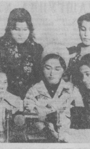
2. Тошкент бети фотоси.