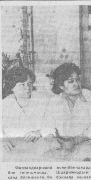
Фарзандларимиз яшли-боқчаларда меҳрибон тарбиячилар ва мураббийлар қўлида яхши тарбия топилмоқда. Шаҳаримиздаги 386-болалар боқчаси коллективидан ота-оналар беҳад хурсанд бўлишяпти. Бу боқчада ишлатилган ҳар бир тарбиячи ўз ишчи сифатидан бажариб, кичикинтойларнинг сикхат-саломат ва бардам усилари учун тинмай қилишяпти.