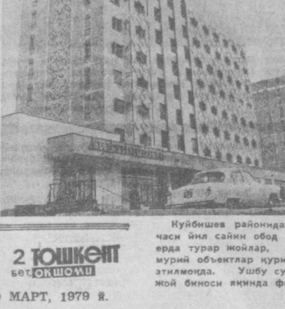
2 ТОШКЕНТ БЕТОҚШОМИ