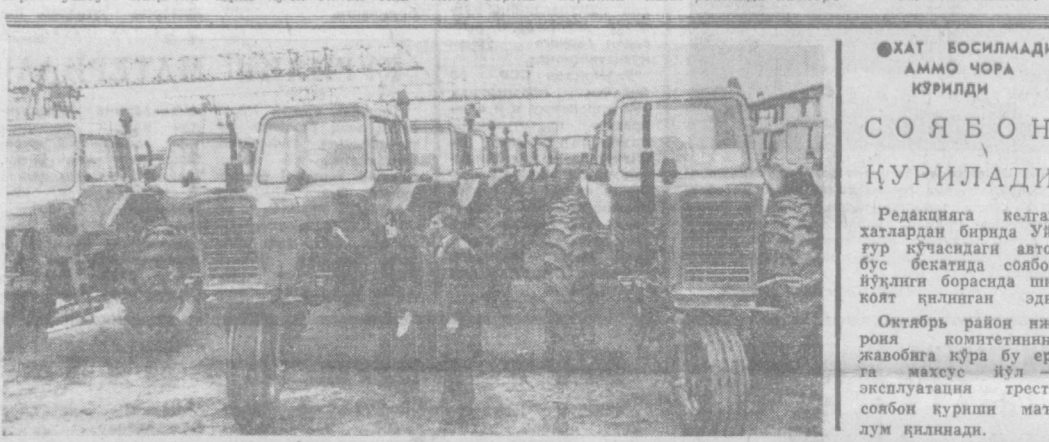
Тошкент трактор заводида ишлаб чиқарилаётган йилги «МТЗ-80» маркали тракторлар пахтакорларга манзур бўляпти.

Пойтахтимиз ва и г Ҳамза районидан «Янгиқош» маҳалласи бундан ўн уч йил муқаддам Тошкент эйвонлиқларидан кейин ташкил этилган эди. Утган давр мубайнида маҳалла ҳар томонлама ободонлашиб, чиройли киефатга кирди, маҳалла кўчалари асфальтланиб тузилар чароғон қилинди. Ҳозир ушбу маҳалла энг рақиб ҳашарлар ҳаётга таъдиқ этилаётган илгор маҳаллалардан бири бўлиб қолди.