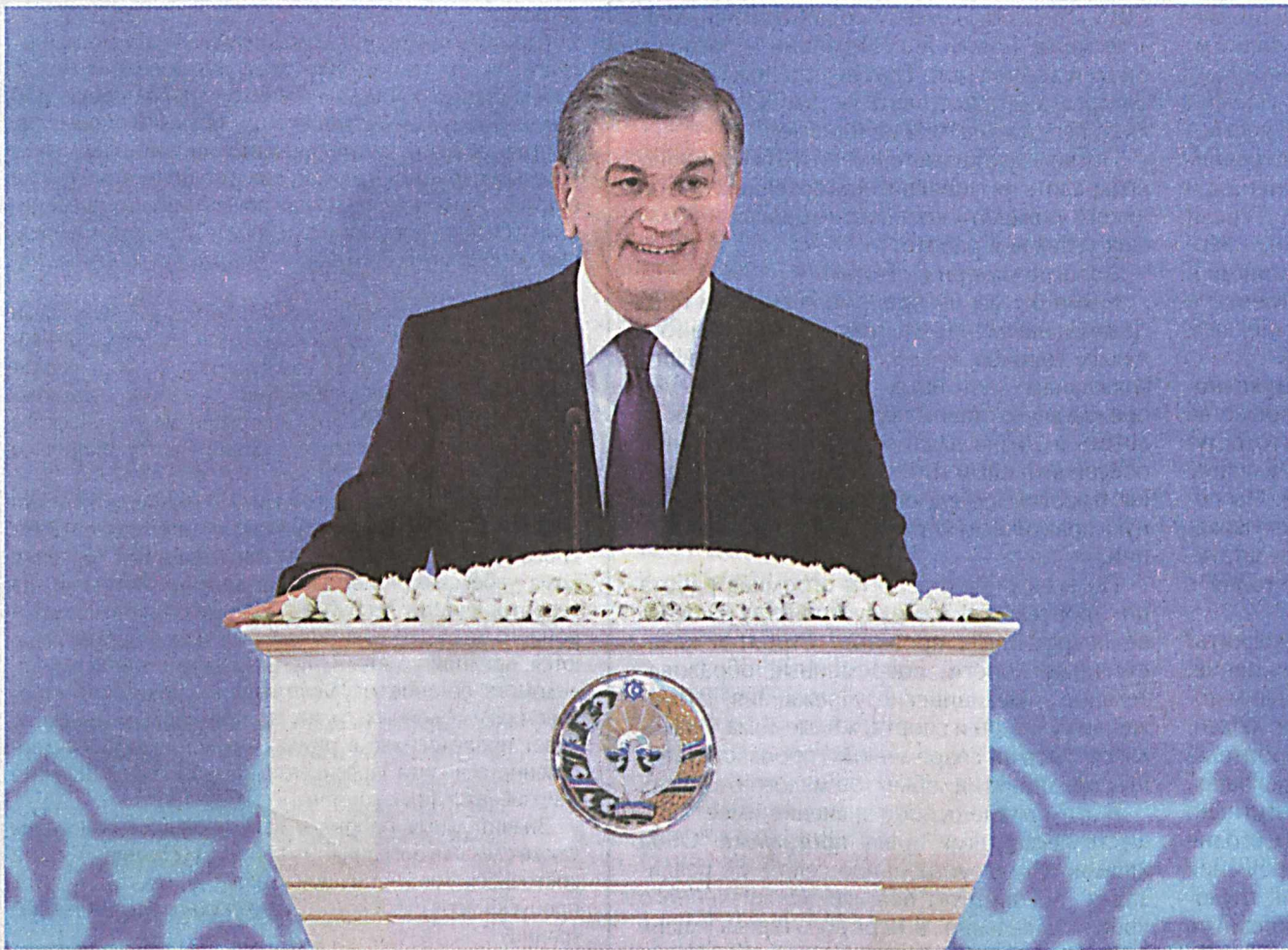
Весна и женщина... В эти дни, когда по всей стране царит дух пробуждения и обновления, мы глубже осознаем, насколько созвучны эти понятия, усиливающие в нас лучшие качества, любовь к жизни, благородные устремления.

В столичном Узэкспцентре состоялось торжественное мероприятие в связи с 8 Марта - Международным женским днем. На мероприятие были приглаше-