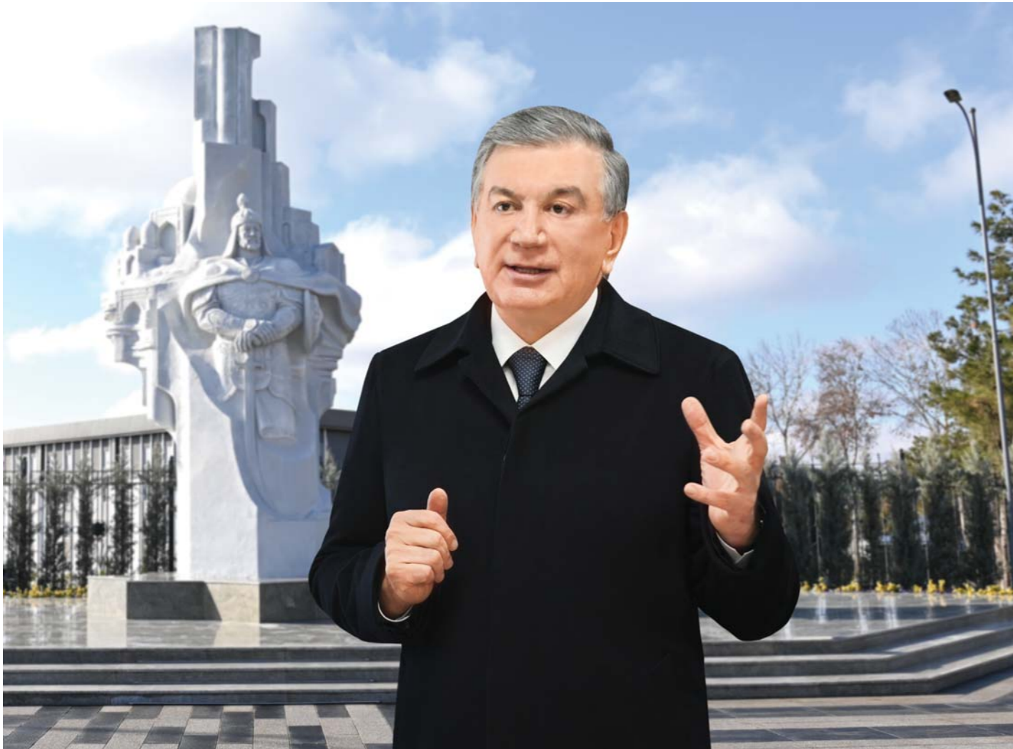
Президенти Ҷумҳурии Ўзбекистон, Сарфармондеҳи Олии Нирӯҳои Мусаллаҳ Шавкат Мирзиёев 7 январ бо фаъолияти муассисаҳои таълимии ҳарбии Хидмати амнияти давлатӣ шинос гардид.

Бо қарори Президент аз 28 июни соли 2019 қорӣ кардани низоми нави тарбияи ҳарбиро ватандӯстонаи наврасон ва тайёркунии кадрҳо барои Нирӯҳои Мусаллаҳ ва хидмати давлатӣ муайян шуда буд. Мувофиқи ин ҳуҷҷат дар таркиби вазоратҳои мудофиа, қорҳои дохилӣ, оид ба вазъиятҳои фа-