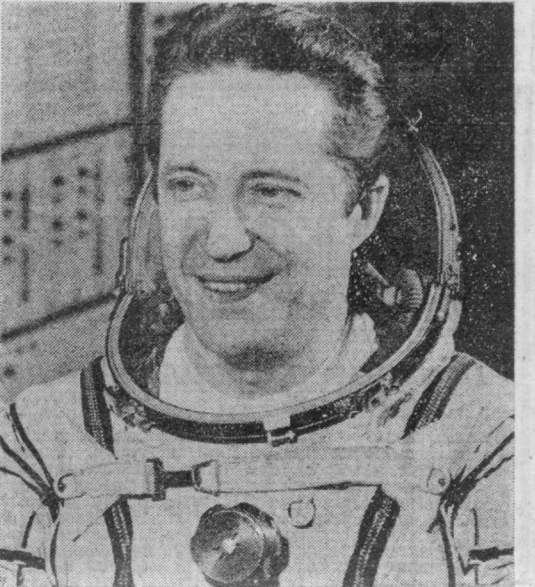
«Союз Т-2» космик кемасининг экипажидан: кема командири Ю. В. Малишев ва бортинженер В. В. Аксенов.