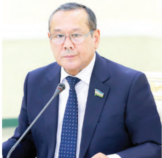
Улуғбек ИНОЯТОВ, Ўзбекистон Халқ демократик партияси Марказий Кенгаши раиси:

— Кеча парламент кўйи палатасининг ялпи мажлисида Қонунчилик палатасининг 2021 йилдаги фаолияти сарҳисоб қилинди ва келгуси режалар белгилаб олинди.